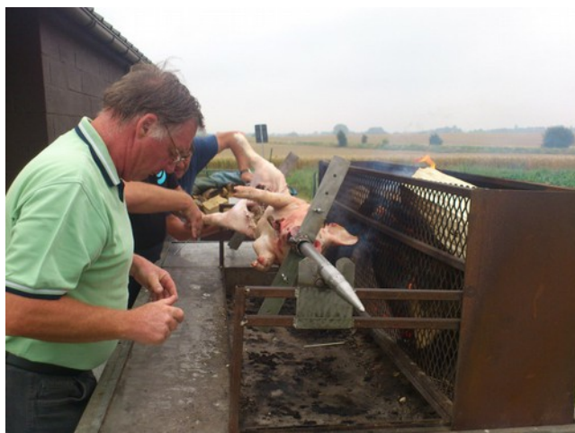
Préparation de la bête, âme sensible ne pas regarder !

Cette année nous avons organisé le dîner, également avec un traiteur , mais de façon différente. Contrairement à l'année dernière, point de farce dans le bestiau. Le cochon fut grillé sur place .Quel régal ! Certains ont moins apprécié. L'après-midi, un seul bémol , notre glacier ambulancier Carette nous a fait faux bon et a brillé par son absence. Dommage, c'était pourtant prévu. Le 21 juillet de l'année prochaine est déjà sur les rails.