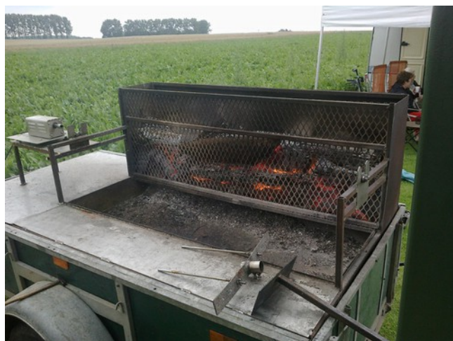
La remorque BBQ en pleine action

Une soixantaine de convives ont participé à cette journée venteuse et ce, dans la bonne humeur. Une rencontre entre anciens et nouveaux membres a fait que chacun y a été de sa petite histoire. Un échange de connaissances très positif ! Malgré une météo un peu capricieuse.