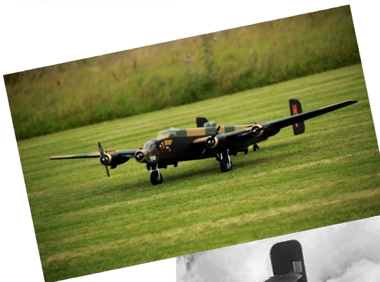
Le Halifax de Michel Aerts