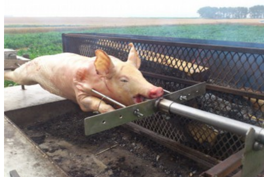
La bête et le BBQ en action !